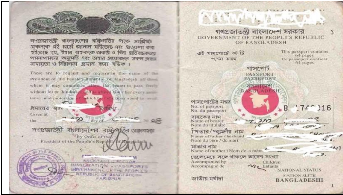
পাসপোর্ট - পেইজ ১