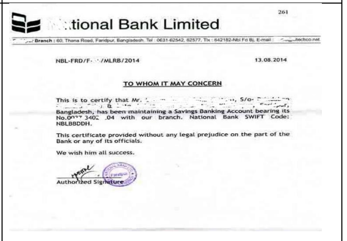
ব্যাঙ্ক অ্যাকাউন্ট সার্টিফিকেট নমুনা কপি

ইতোমধ্যে যারা আবেদন করেছেন তাদের পুনরায় আবেদন করা নিষ্প্রয়োজন ব্যাঙ্ক চার্জ বাদ দিয়ে বীমার টাকা কোরিয়া থেকে সরাসরি আবেদনকারীর অ্যাকাউন্টে পাঠানো হয়। এ জন্য কোন পর্যায়েই কোন প্রকার টাকা পয়সা কাউকে দিতে হয় না।