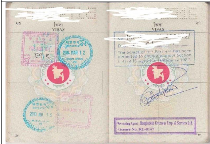
পাসপোর্ট -সর্বশেষ ডিপার্টচার সীল (কোরিয়া ইমিগ্রেশন)