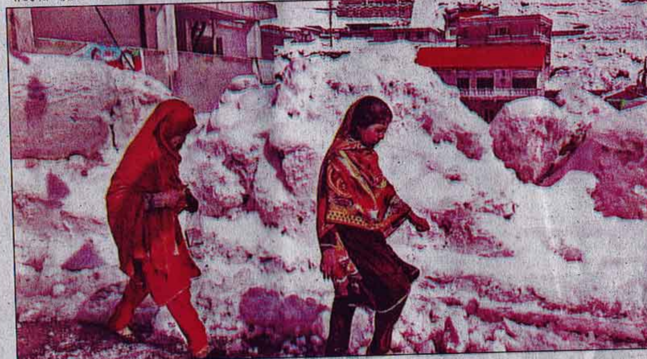
পাকিস্তানের প্রত্যন্ত অঞ্চলে অপ্রত্যাশিত তুষারপাত ও বৃষ্টিতে ২২ জন শিশুসহ ৩৫ জন নিহত